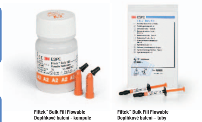
Filtek™ Bulk Fill Flowable Doplňkové balení - kompule